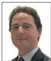
Carlo Alberto Demichelis

sione al Parlamento europeo del 28 settembre 2017, che nel rilevare l'importanza e la crescita del fenomeno dell'utilizzo del canale online per la diffusione e distribuzione di contenuti illeciti, richiede agli operatori del settore progressi tangibili nell'adozione di misure preventive e proattive volte a contrastare efficacemente tale fenomeno, tra l'altro determinando un orizzonte temporale ben preciso (maggio 2018) trascorso inutilmente il quale verranno proposte misure normative volte a rafforzare il dovere di diligenza in capo agli operatori del commercio elettronico».