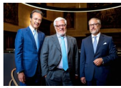
Due donne nel comitato esecutivo di Gop